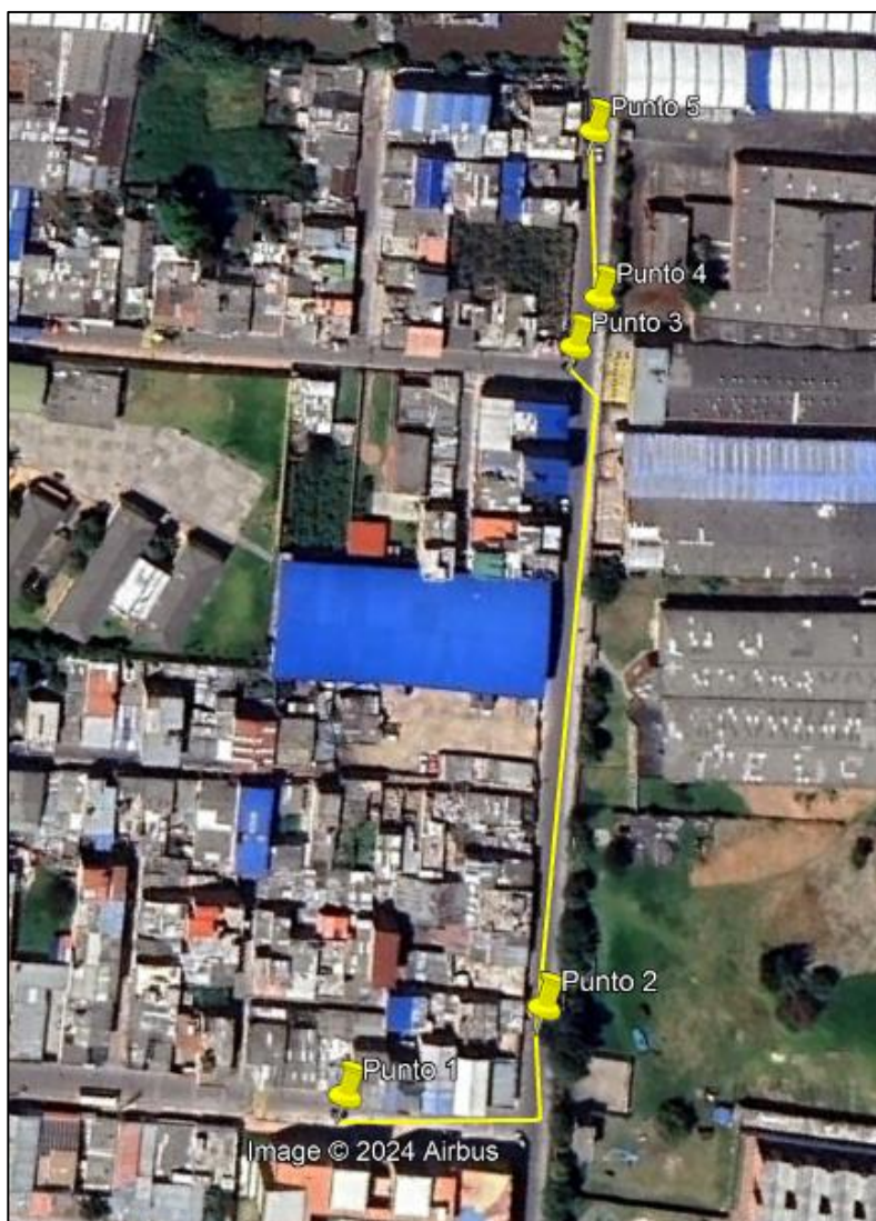
Ilustración 1. Recorrido verificación ambiental

Con base en lo anterior, el día 05 de septiembre de 2024 se realizó recorrido de control y vigilancia en el barrio El Hato desde las coordenadas 4°42'25,572"N- 74°12'3,858"W hasta las coordenadas 4°42'23,748"N- 74°12'11,478"W (ver ilustración 1. Ruta amarilla).